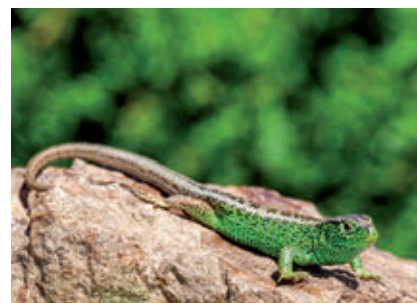
Groupe : Reptiles Famille : Lacertidae Espèce : Lézard des souches Lacerta agilis (Linnaeus, 1758)