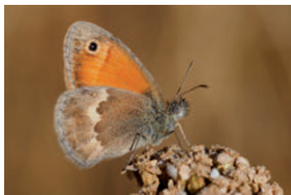
Groupe : Insectes, Lépidoptères Famille : Nymphalidae Espèce : Fadet des tourbières Coenonympha tullia (O.F. Müller, 1764)