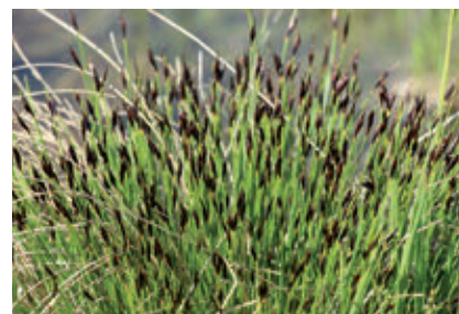
Groupe : Angiospermes Famille : Cyperaceae Espèce : Choin ferrugineux Schoenus ferrugineus (Linnaeus, 1753)