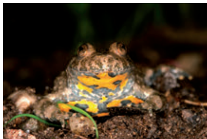
Groupe : Amphibiens Famille : Bombinatoridae Espèce : Sonneur à ventre jaune Bombina variegata (Linnaeus, 1758)

Espèces des zones humides du nord de l'albanais à statut réglementé présentes à Chavanod