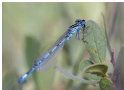
Groupe : Insectes, Odonates zygoptères Famille : Coenagrionidae Espèce : Agrion de Mercure Coenagrion mercuriale (Charpentier, 1840)