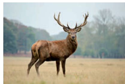
Groupe : Mammifères Famille : Cervidae Espèce : Cerf élaphe Cervus elaphus (Linnaeus, 1758)