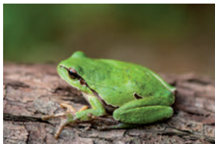
Groupe : Amphibiens Famille : Hylidae Espèce : Rainette Verte Hyla arborea (Linnaeus, 1758)